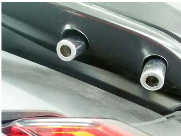
Mounting ref. 1