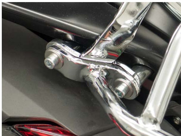
Mounting ref. 1A