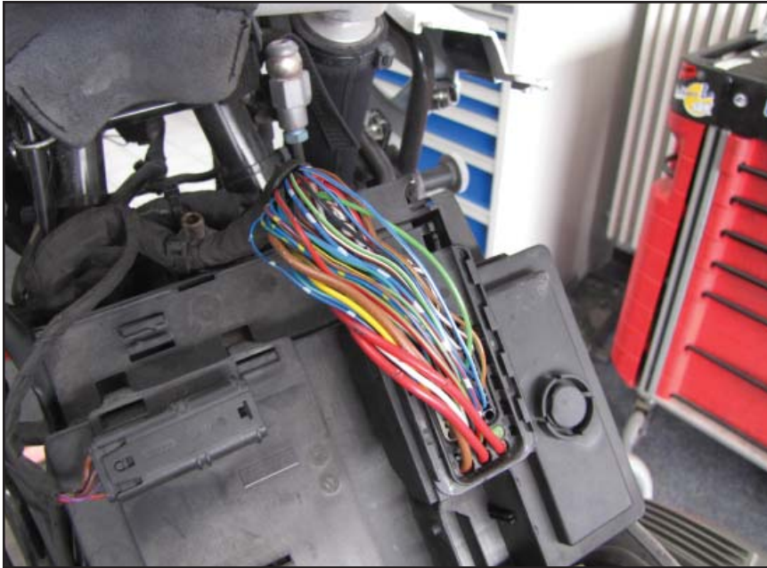
Anschluss bei R 1200 GS