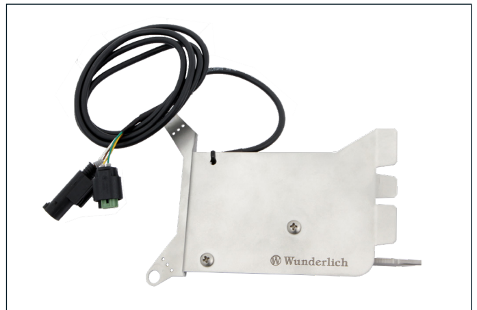
Verhindert zuverlässig den Diebstahl des Navis. Anschluss: Plug and Play