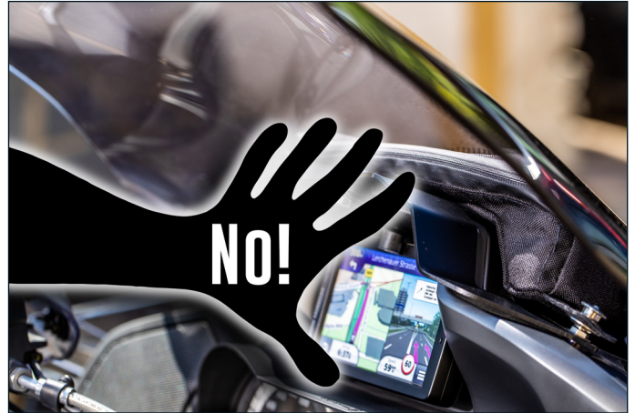
Navi Sicherung für die BMW R 1250 RT und R 1200 RT LC mit Zentralverriegelung (Art.-Nr.: 21170-502)