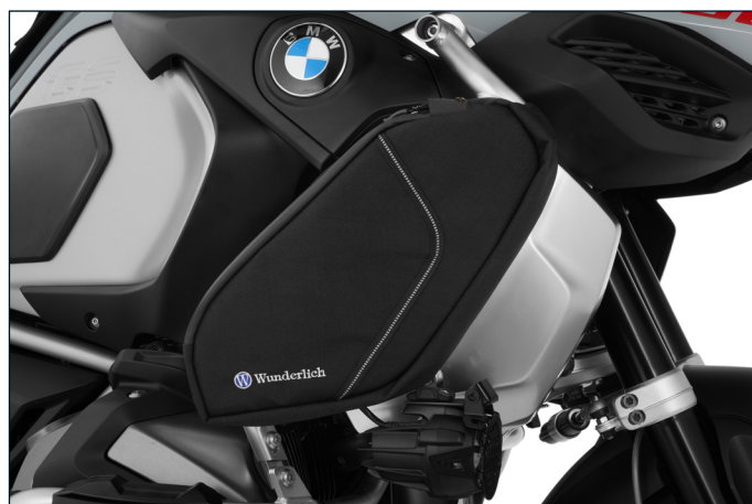
Perfekt integriertes Design: Tankschutzbügel mit ... (Art.-Nr.: 20810-300)