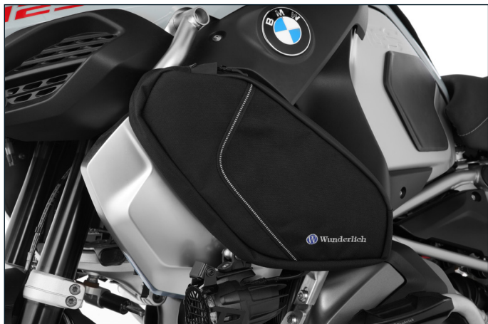
Doppelpack: Die Schutzbügeltaschen aus der Reihe „ELEPHANT & Co.“ passen maßgeschneidert jeweils rechts und links am Tankschutzbügel (Art.-Nr.: 20810-300)