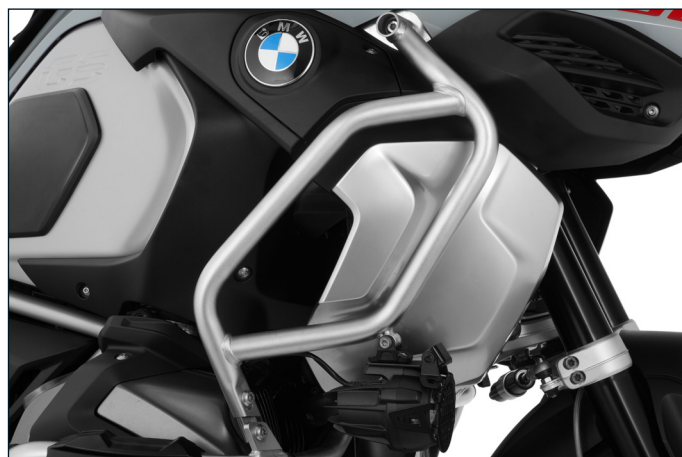
... und ohne Tankschutzbügeltasche (Art.-Nr.: 20810-300)