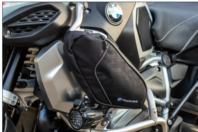
Bietet idealen Platz für alles, was man unterwegs gerne griffbereit unterbringen möchte (Art.-Nr.: 20810-300)