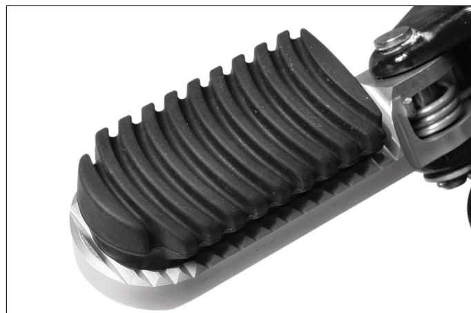
Rastengummis schützen das Schuhwerk, dämpfen Vibrationen und sorgen dabei für noch mehr Komfort und Sicherheit