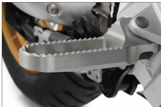
Präzise gefertigt aus hochfestem Aluminium, damit ist der Rastensatz für höchste Ansprüche ausgelegt