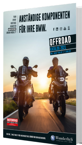
Der 640-seitige Offroad-Katalog umfasst alle BMW-Adventure Modelle inklusive der S 1000 XR und der F 900 XR.