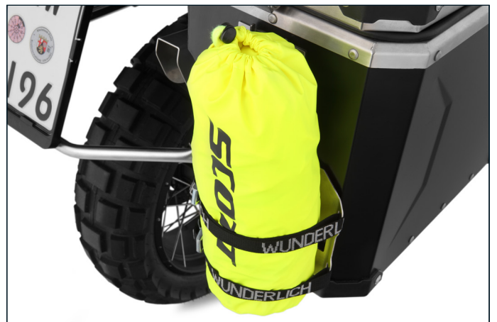
Das Wunderlich Koffer-Rack passt an die hauseigenen Alu-Koffer und Topcases namens EXTREME genauso, wie an die originalen BMW-Aluminiumkoffer