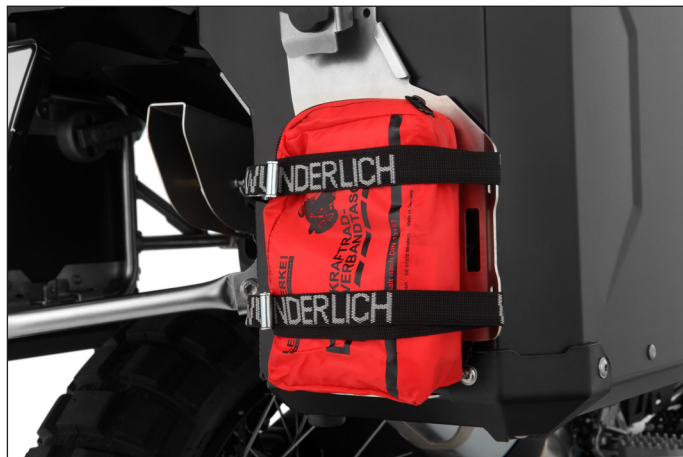
Die Sicherung erfolgt mittels Gurtbändern oder Expandern und den im Rack integrierten zahlreichen Zurröffnungen