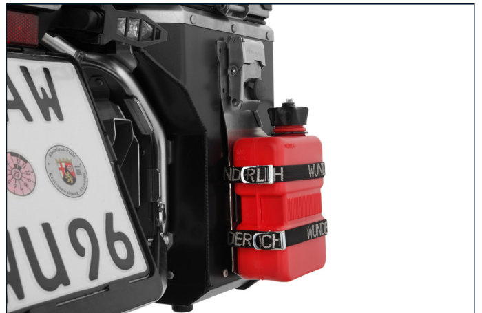
Die perfekte Ergänzung für alles, was entweder schnell griffbereit sein soll oder im Koffer nichts zu suchen hat