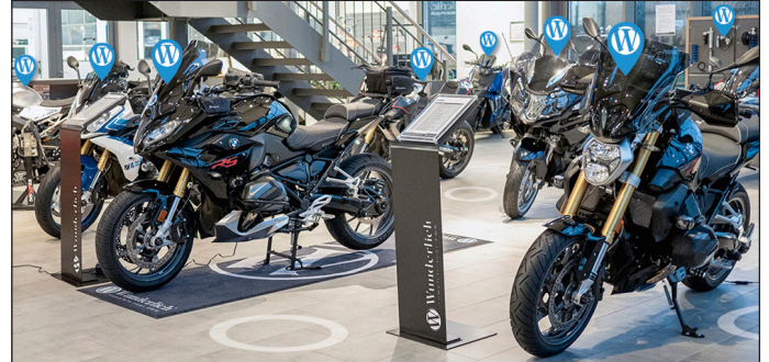
Hereinspaziert – Wunderlichs Interaktiver Showroom - Abwechslungsreich, unterhaltsam, ansprechend und aktuell

Für die Zukunft sind spezielle Aktionen im Interaktiven Showroom geplant. Die digitale Ausstellung wird rollierend aktualisiert. Zwei gute Gründe für den regelmäßigen Besuch, bei dem es stets Neues zu entdecken gilt.