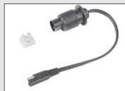
BS25 bikestart ®-Stecker connector / connecteur

BAAS bike parts Burgstr. 15 D-74232 Abstatt